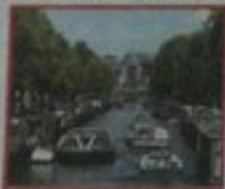
• Veel stormen hebben de woonboten al overleefd, maar er is een nieuwe op komst

Het stadsdeel streeft naar binnen tien jaar meer ruimte op de grachten, beter zicht op het Amsterdamse culturele erfgoed, herstel van de transportfunctie van het water en mogelijkheden voor hotelboten.